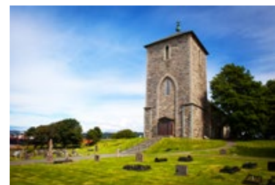
Avaldsnes, Norges eldste kongesete.