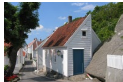
Seilskutebyen Skudeneshavn.

Vignes Grubeområde har Norsk Kulturarvs kvalitetsmerke Olavsrosa.