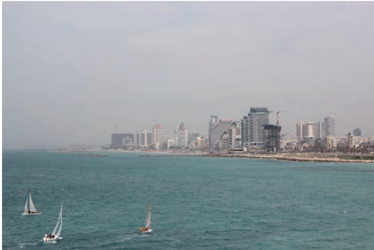
Tel Aviv sett fra nabobyen Jaffa.