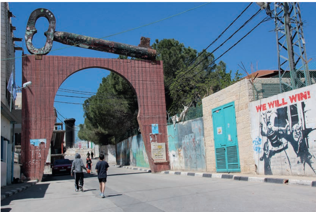
Bak muren på Vestbredden.