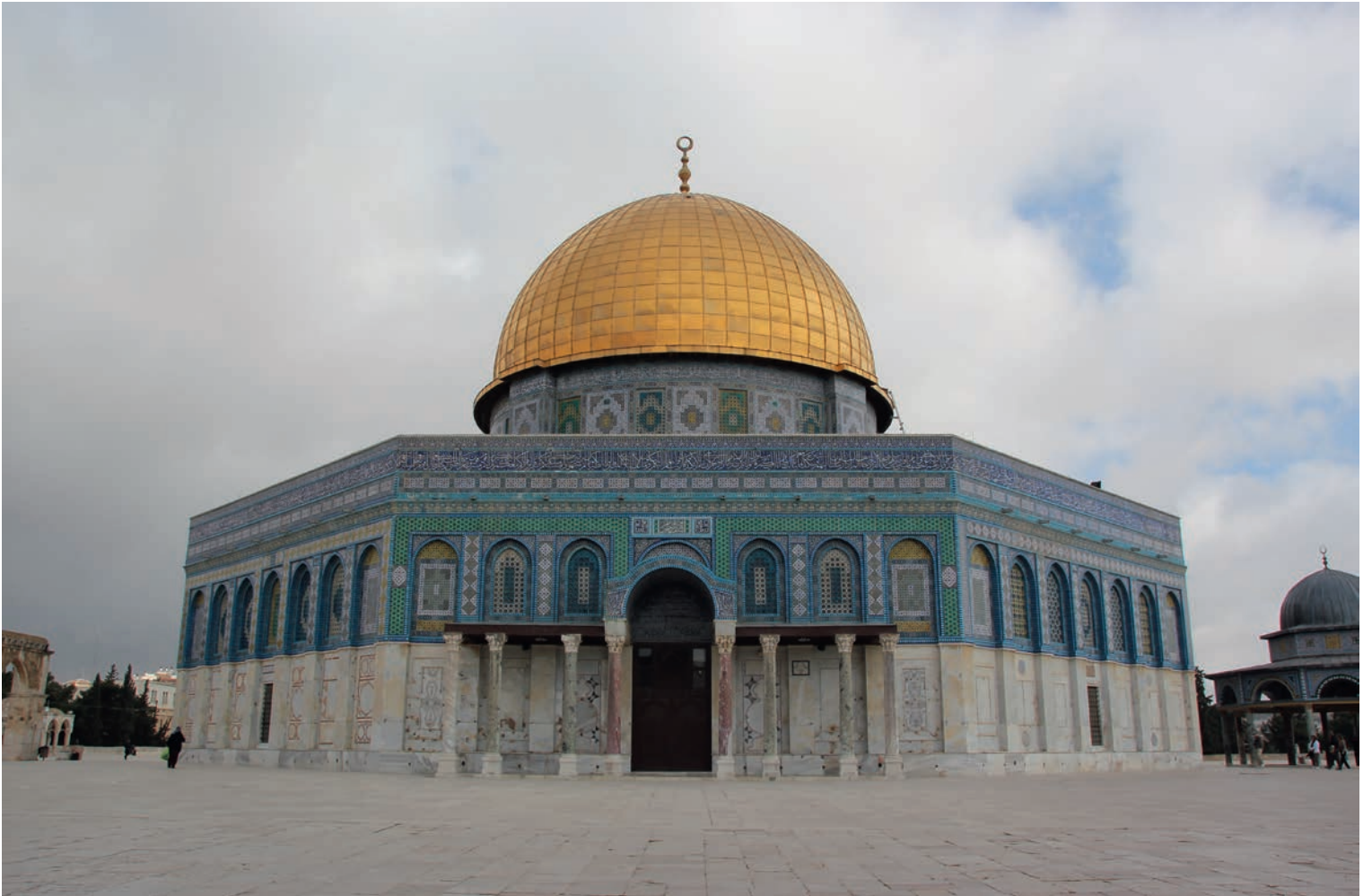
Klippedomen i Jerusalem.