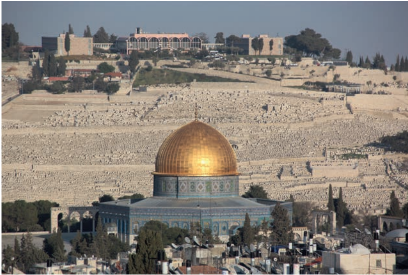
Jerusalem ligger bare en og en halv times biltur unna Tel Aviv.