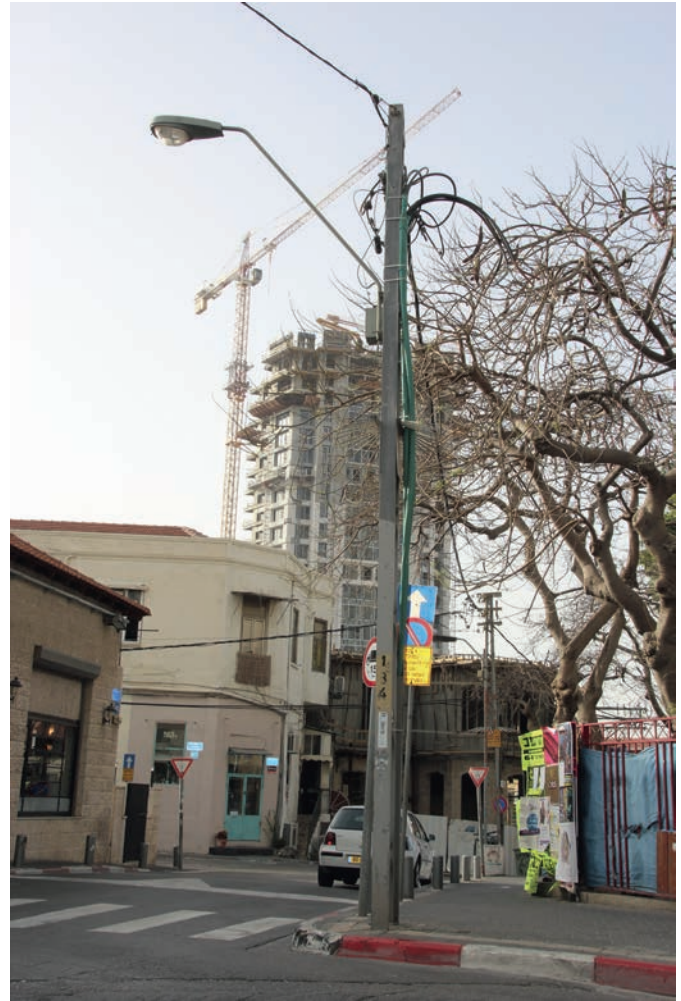
Kontrasten er stor mellom nybygg og eldre bebyggelse i Tel Aviv.