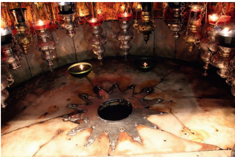
I Betlehem. Dette er stedet det blir antatt at Jesus Kristus ble født.