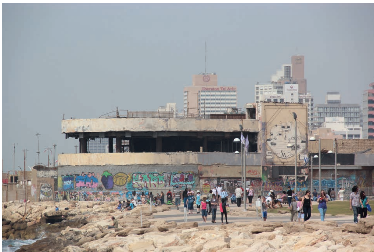
Ungdomsdiscoen som ble bombet i 2001 har stått slik siden – som en konstant påminnelse om det som hendte

– IT'S LIKE being in a camp , sier servitøren vår. Hun står foran meg på en kafé sentralt plassert på livlige Rothschild Avenue og forteller om livet som militær. Eller mer presist, hun forteller om de mange frihelgene tilbrakt i Tel Aviv gjennom de to årene hun avtjente i militæret. Som så mange andre kvinner og menn som tjenestegjør i den israelske hæren, dro hun jevnlig tilbake til Tel Aviv for å slappe av og ta seg en fest.